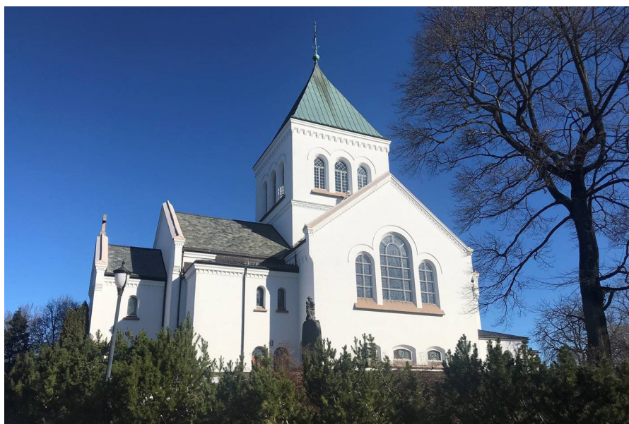
Ullern kirke är en av kyrkorna i Osloområdet som ingår i uppdraget.

- Vi är stolta över att ha fått uppdrag både åt norska kyrkan och försvaret. Vito har en bredd och expertkompetens som teknisk entreprenör som gör att vi kan leverera det kunden behöver oavsett vilken typ av fastighet det är, säger