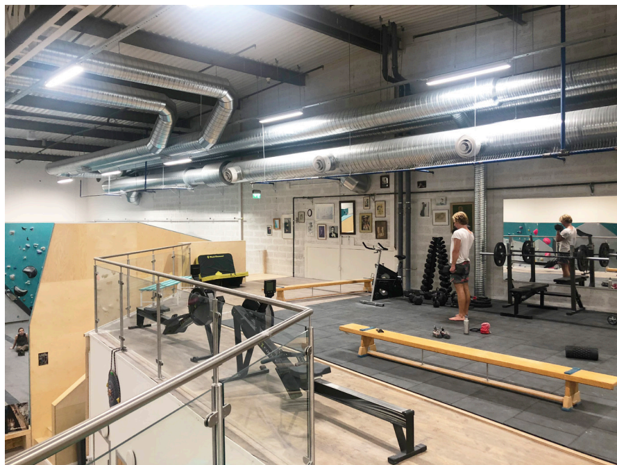
Förutom anläggningar för inomhusklättring och parkour finns ett gym på övervåningen.

Kusbo Bygg & Entreprenad är beställare med Corem Property Group som fastighetsägare. Projektet har drivits som ett partneringsprojekt. Lokalerna för Klättercentret, Katana Parkour och Busfabriken har tidigare använts av Posten. ■