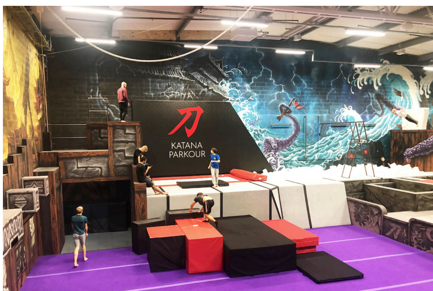
Parkour är rörelseträning och kroppskontroll där man enbart kroppens hjälp ska ta sig förbi olika typer av hinder.