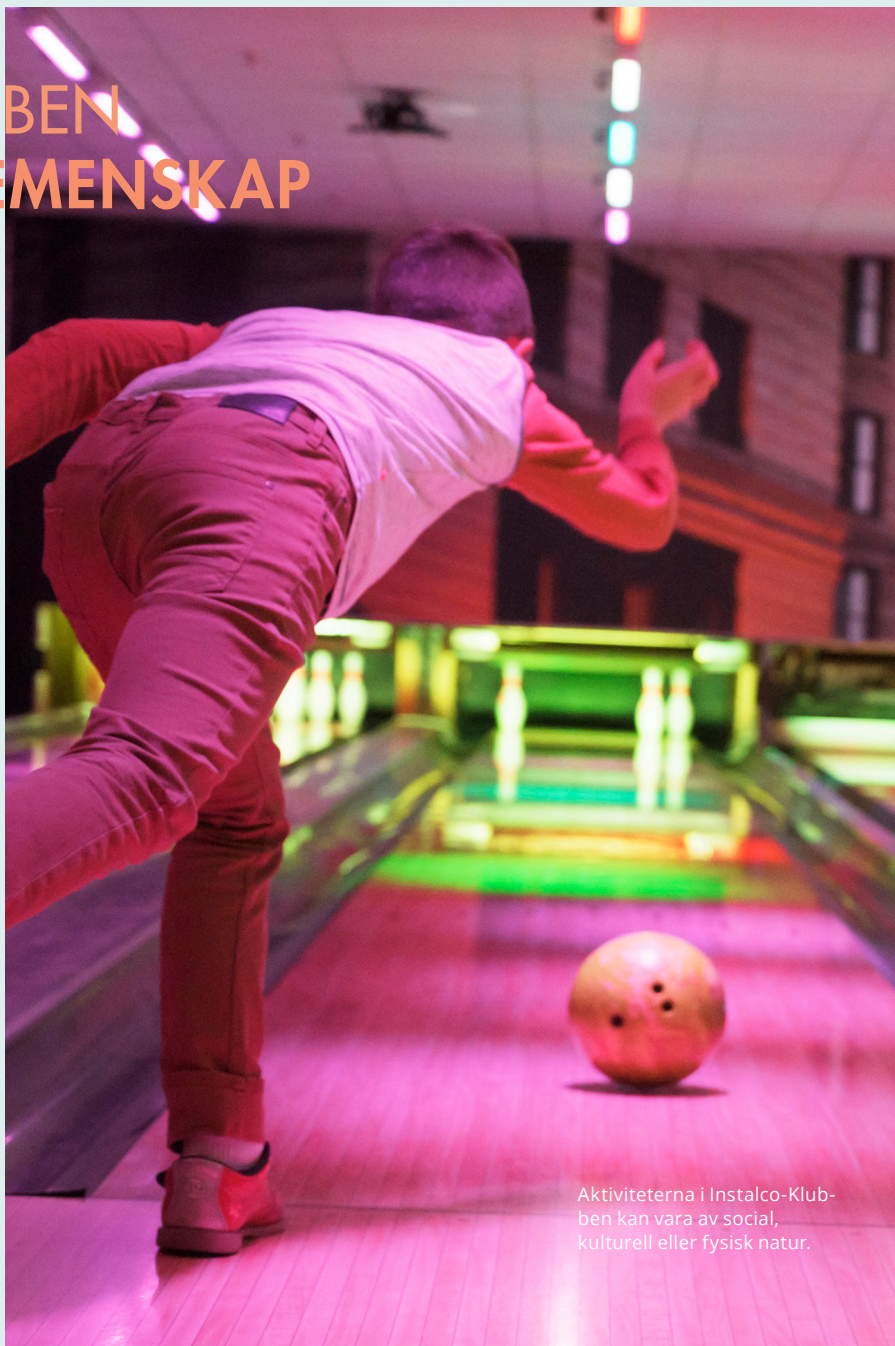
Aktiviteterna i Instalco-Klubben kan vara av social, kulturell eller fysisk natur.

Powerjoggen samlade totalt in 24 660 kr till Min Stora Dag. ■