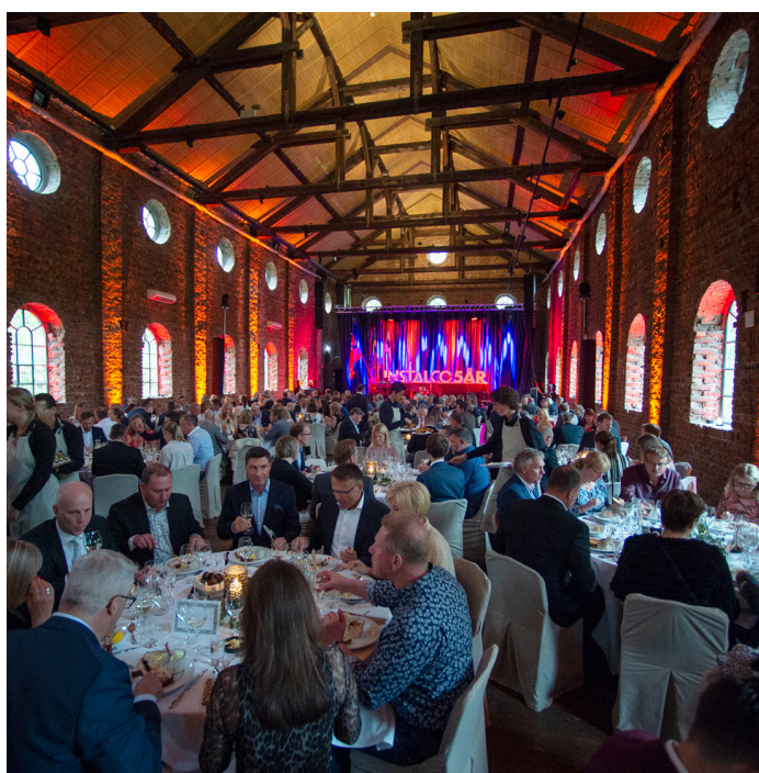
Instalco firade 5 år på Winterviken i Stockholm.